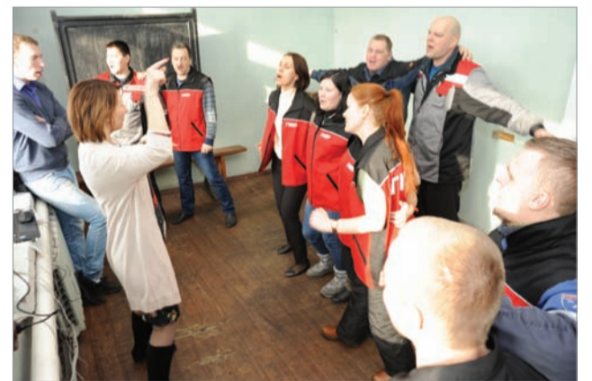
На репетиции хора профкома