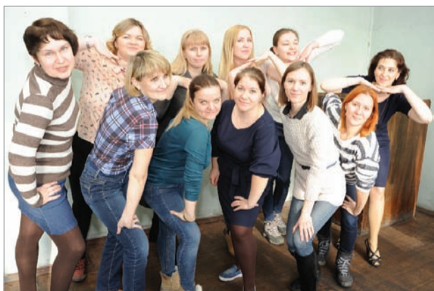
На репетиции хора заводоуправления

Уже на этой первой встрече хоров и наставников многие из участников смогли дать ответ, каким будет их репертуар. А по условиям конкурса каждый хор должен исполнить две песни: песню о людях труда и танцевальный мега-хит. Читатель, конечно, понимает, что такое песня о людях труда – сразу вспоминается музыкальное сопровождение легендарных фильмов советской эпохи: «Девчата», «Весна на Заречной улице», «Высота» и других. Другое дело танцевальный мега-хит – здесь простор для фантазии гораздо шире. Кстати, для коллектива выбрать две или даже одну песню в такой ситуации не так уж легко, как может показаться. Ведь двенадцать человек подразумевают под собой двенадцать мнений, и некоторые коллективы не могли справиться с данной задачей еще несколько дней, репетируя одну песню и споря относительно второй!