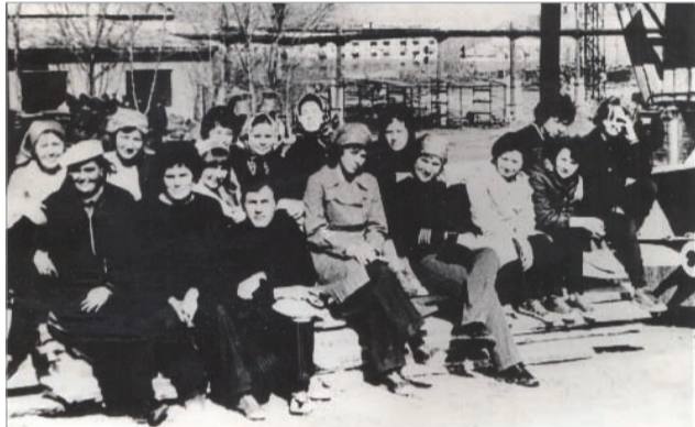
Участники комсомольского субботника в ремонтно-строительном цехе комбината

После пуска первой электропечи, в ноябре 1930 года, продолжилось строительство других электропечей. И 29