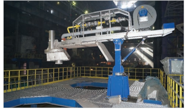
Газовая горелка для сушки футеровки чаши конвертера

С этой же компанией SAC заключили контракт на базовое проектирование нового участка по производству особо чистого марганца. У них есть собственная