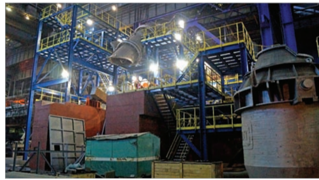
Почти готовое сооружение конвертера и его чаша (справа)

В мае, в крайнем случае в июле, будет остановлена 42-я печь в цехе № 7. Это будет начало грандиозной реконструкции, сравнимой с реконструкцией 57-й печи. Строить ее будем целый год. Это, конечно, напряженный срок, но мы 57-ю построили за 13 месяцев вместе с насосной станцией. А здесь насосной станции не будет – должны уложиться за