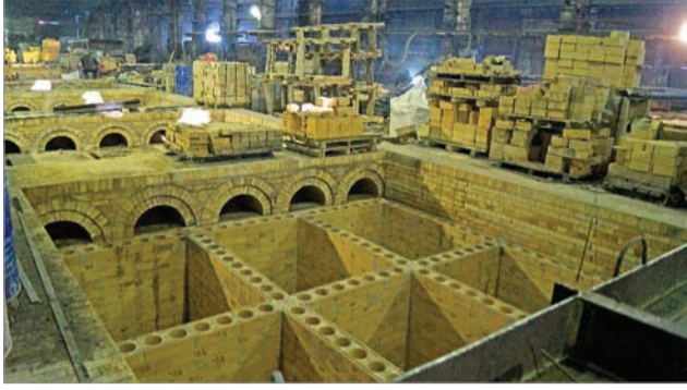
Обжиговая печь № 2

Итак, к 18 марта мы планируем все смонтировать, завершить стройку. По предварительным плановым срокам, 16–20 апреля будем проводить пусконаладочные работы на конвертере (будет производиться проверка систем управления, электрических систем, опробование всех механизмов). По графику производства в мае конвертер уже должен работать. Для нас это оборудование новое, поэтому мы не имеем ни опыта запуска, ни опыта эксплуатации таких объектов, вследствие чего есть некоторые опасения – не знаем, где могут возникнуть трудности.