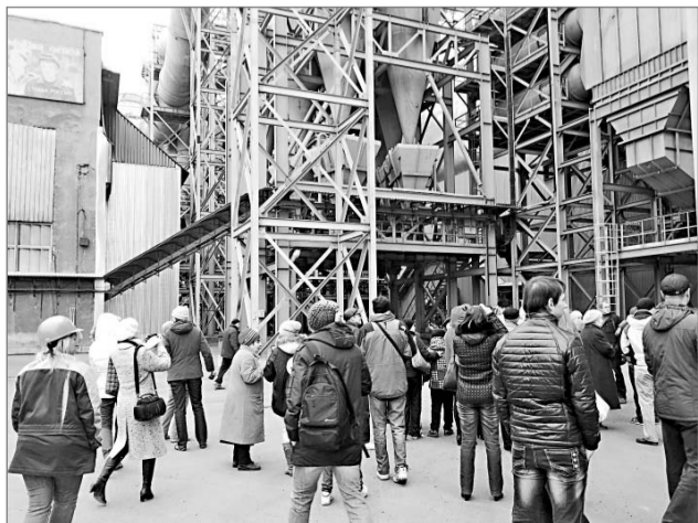
Газоочистка второго цеха

Во втором цехе люди осматривали запущенную в этом году грандиозных размеров газоочистку и увидели, как наполняется в биг-беги уловленная этой системой пыль из печей. Все вопросы, как обычно, были из цикла «что вижу,