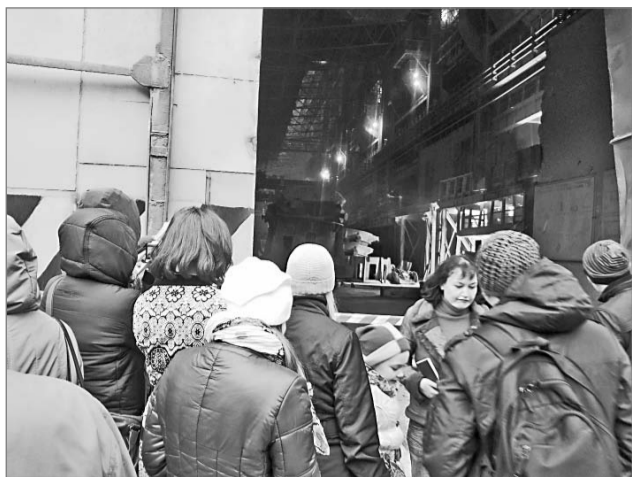
У ворот шестого цеха