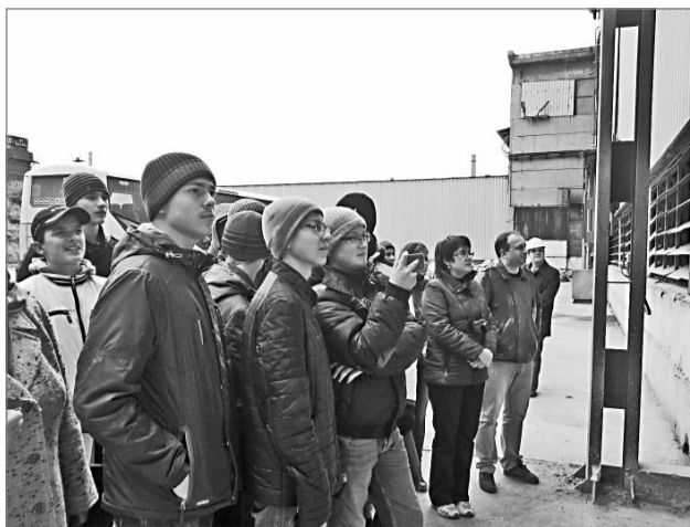
Учащиеся лица наблюдают за разливкой феррохрома

Надо сказать, население города активно заинтересовалось возможностью узнать ближе о том, что творится на ЧЭМК, потому что автобусы каждый раз заполнялись до отказа. Путешествие началось в 11.00 от остановки напротив здания бывшего теплотехнического института. Пока люди ехали до первой проходной, их вкратце познакомили с богатой историей комбината, а также инструктировали по правилам техники безопасности поведения на производстве. На самом