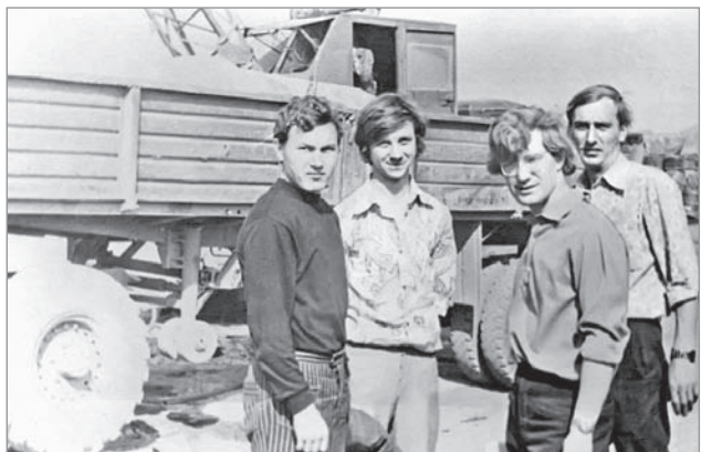
Участники субботника по сбору металлического лома, организованного комитетом ВЛКСМ комбината