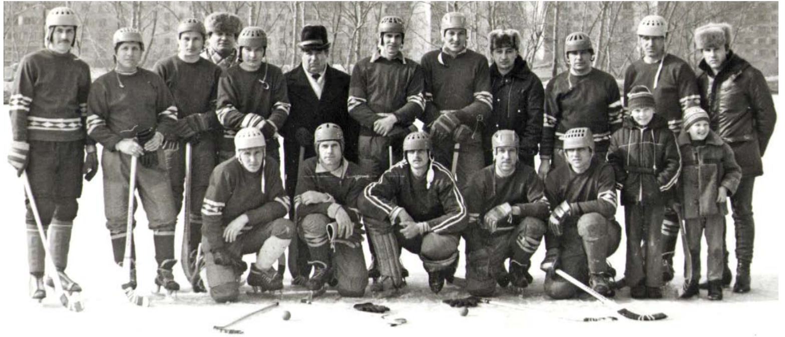
Команда «Электрометаллург». Конец 1970-х

Открываем январь 1959-го, а наши тут уже громят всех подряд! В номере от 19 января написано: «Значительных успехов добились в этой спартакиаде хоккеисты нашего завода (в то время ЧФЗ – прим. ред.)... В