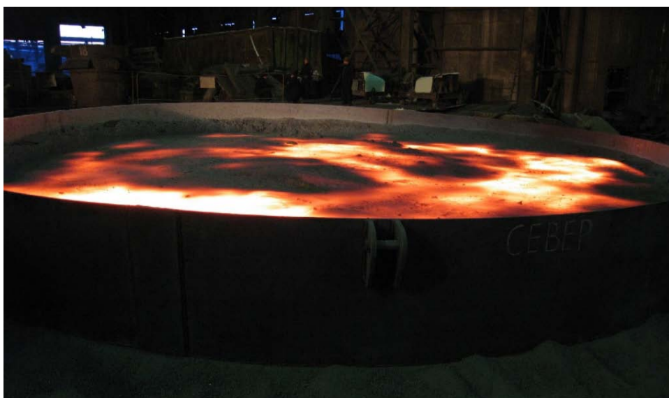
Разливка на полигон

Что же, остается порадоваться за технологов седьмого цеха – в скором времени проблемы с разливкой у них должны уменьшиться.