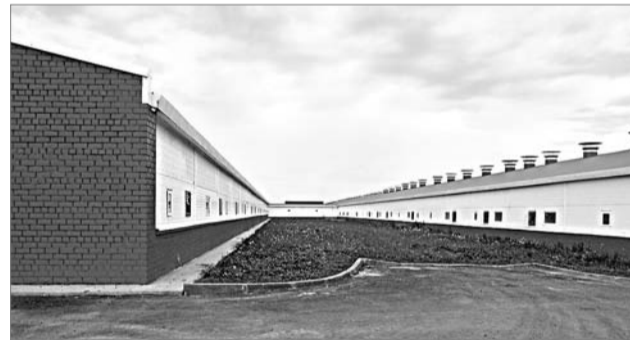
Корпуса Каменского СВК