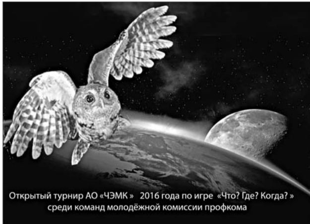
Открытый турнир АО «ЧЭМК» 2016 года по игре «Что? Где? Когда?» среди команд молодежной комиссии профкома

Понятно, что на таком большом заводе, как наш, просто по статистике должны найтись эрудированные